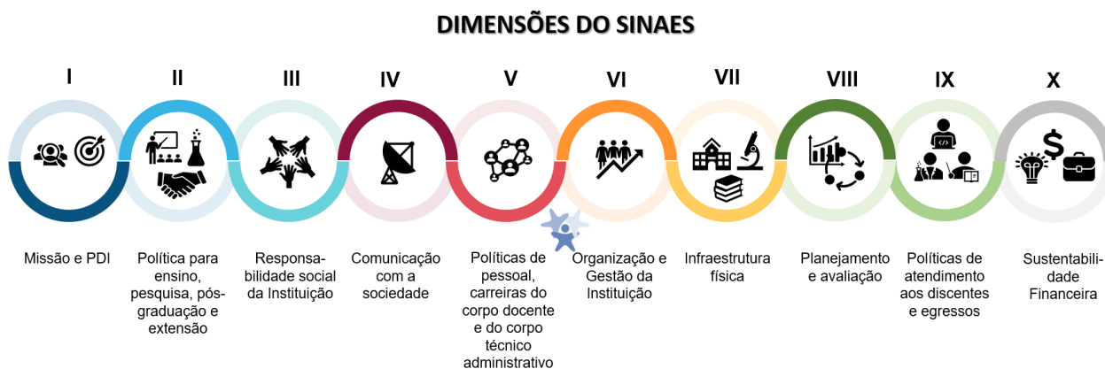
Figura b Dimensões do SINAES

A IES desenvolve um processo avaliativo que se baseia na escuta ativa de todos os setores envolvidos com a instituição na qual todos avaliam e são avaliados (direta ou indiretamente). Os processos de avaliação conduzidos pela CPA subsidiam os atos regulatórios institucionais e de cursos, bem como o desenvolvimento da instituição, sendo de competência e responsabilidade da CPA elaborar, a partir dos resultados apurados, o relatório de Autoavaliação pautado nas 10 dimensões que constam no SINAES conforme ilustrado abaixo.