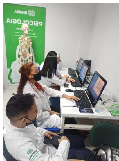
CPA – Alunos de Psicologia