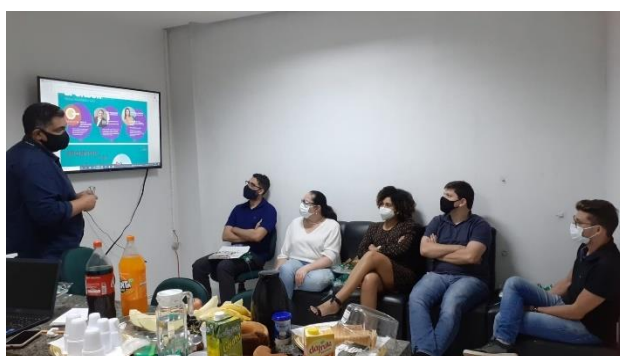
CPA – Apresentação de Resultados

Acontecimentos esses que foram agendados para que fosse realizada a avaliação, foi reforçada pela Direção e coordenação nos grupos oficiais e pelo NAE e pela equipe da CPA, a importância de efetivarem sua avaliação. Os principais pontos foram avaliados pela administração e ações foram tomadas no sentido de apoiar a construção de melhoria contínua que a avaliação institucional proporciona.