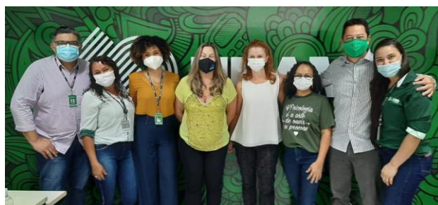
CPA – Visita do MEC