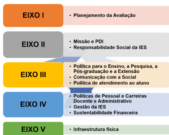
Figura a Dimensões do SINAES

Desta forma, os eixos de avaliação englobarão as dimensões conforme mostrado na figura a seguir.