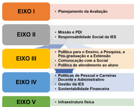
Figura 1 Dimensões do SINAES

Desta forma, os eixos de avaliação englobarão as dimensões conforme mostrado na figura a seguir.