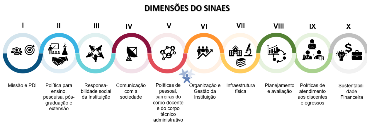
Figura 2 Dimensões do SINAES

A IES desenvolve um processo avaliativo que se baseia na escuta ativa de todos os setores envolvidos com a instituição na qual todos avaliam e são avaliados (direta ou indiretamente). Os processos de avaliação conduzidos pela CPA subsidiam os atos regulatórios institucionais e de cursos, bem como o desenvolvimento da instituição, sendo de competência e responsabilidade da CPA elaborar, a partir dos resultados apurados, o relatório de Autoavaliação pautado nas 10 dimensões que constam no SINAES conforme ilustrado abaixo.